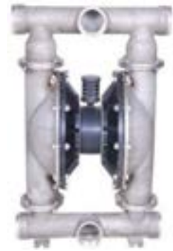
AOD 800 SS Atornillada