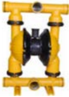
AOD 80 CI Fijada