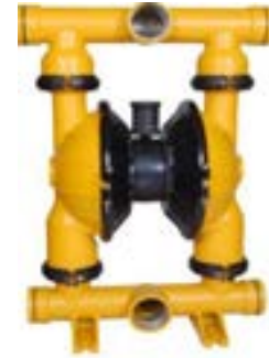
AOD 80 AL Fijada