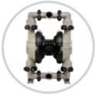
AOD 50 SS Fijada

Modelo FIJADO disponible para aplicaciones específicas