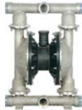
AOD 500 SS Atornillada