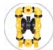
AOD 50 PP Fijada

Modelo FIJADO disponible para aplicaciones específicas