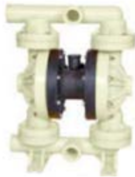
AOD 500 PVDF Atornillada