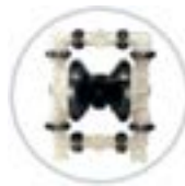
AOD 50 PVDF Fijada

Modelo FIJADO disponible para aplicaciones específicas