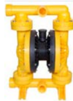
AOD 500 PP Atornillada