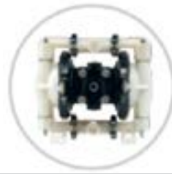
AOD 15 PVDF Fijada

Modelo FIJADO disponible para aplicaciones específicas