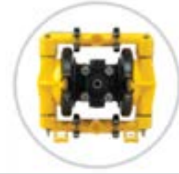
AOD 15 PP Fijada

Modelo FIJADO disponible para aplicaciones específicas