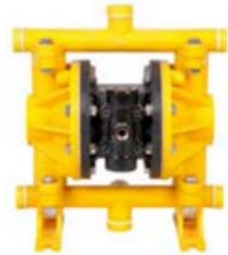
AOD 150 PP Atornillada