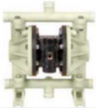
AOD 150 PVDF Atornillada