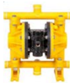
AOD 150 AL Atornillada