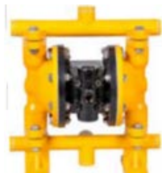
AOD 150 CI Atornillada

Modelo FIJADO disponible para aplicaciones específicas