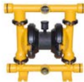
AOD 40 AL Fijadada