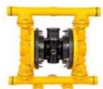
AOD 300 CI Atornillada