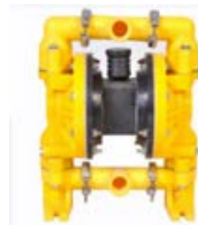
AOD 300 AL Atornillada