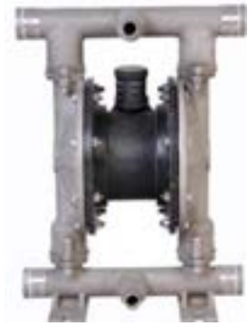
AOD 300 PP Atornillada