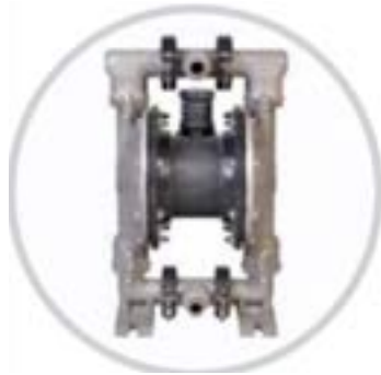
AOD 30 SS Fijada

Modelo FIJADO disponible para aplicaciones específicas